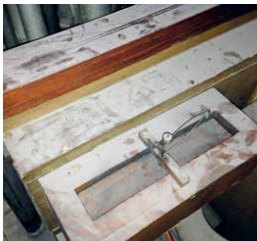
Die helle Farbe des Staubs und die Abdrücke auf den braunen bzw. mahagonifarbenen Windkanälen zeigen die Intensität der Verschmutzung.

ungeplante „Noteinsätze“ von Orgelbaufirmen durchgeführt werden, damit neue aufgetretene Defekte kurzfristig abgestellt werden konnten.